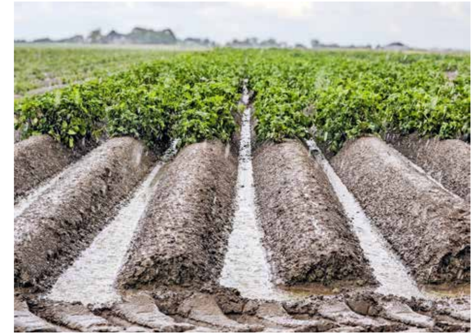
HZPC verwacht een lagere pootgoedopbrengst als gevolg van de natte weersomstandigheden

Dat de processen in de agro-food sector ingewikkeld kunnen zijn, beaamt