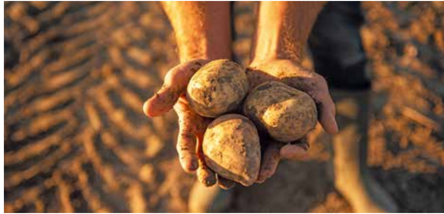
HZPC ziet dat er sprake is van disbalans in de pootgoedmarkt.

overzicht te hebben en snel te kunnen plannen op een Europese schaal. We kunnen snel zien wat het effect van bepaalde omstandigheden is op de volgende generaties pootgoed.”